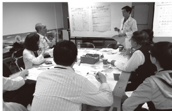
圖二、進階教師培育課程－世界咖啡館活動剪影