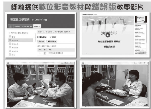
圖1、數位影音教材與教學影片

本課程藉由讓學員角色互換，換個角度去思考，了解溝通最重要的就是願意發自內心傾聽與觀察所需，這樣不管面對什麼溝通難題，皆能迎刃而解，相信在有效的溝通下，定能提供更優質的藥物諮詢服務。