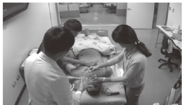
PGY急救模擬訓練課程- 4