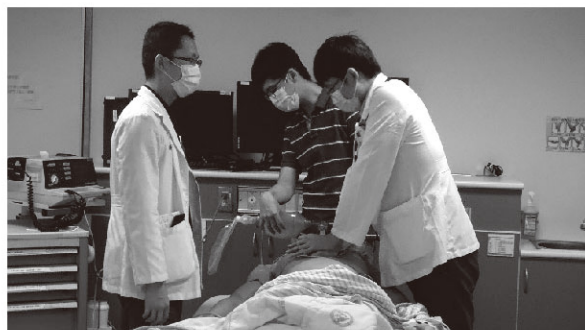
PGY急救模擬訓練課程-2