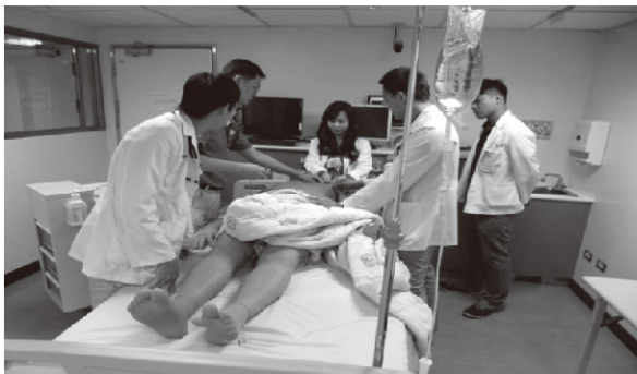
PGY急救模擬訓練課程-3

PGY急救模擬訓練課程執行方式：由於學員在此課程之前已於PGY訓練中上過急救訓練和跨領域團隊合作技巧的課程，因此在訓練課程中不再做基本的知識介紹，會直接以急診案例的形式讓學員實作演練。課程開始時，由老師先執行模擬情境學環境介紹，在讓學員們對模擬環境和高擬真模擬人Istan做初步認識後由學員之間選出隊長（Leader）。確認隊長後會給予一段時間讓隊長對其他的隊員做出可能的急救事件並執行任務分配，也就是TRM中執行領導能力的事前說明（brief）。當學員和場景準備好，現場便開始進行模擬，老師會在錄控室遠端開始操作模擬人並廣播說明模擬案例之情境，學員模擬操做過程全程錄影，老師由錄控室遠端觀察評估每一個學員於這個案例的急救表現與在團隊之間合作能力。當急救結束後，老師與學員會回到討論室，藉著學員操作演練的錄影的內容，與學員分析並做事後討論，讓學員藉由討論去了解可進步的地方（debrief）。討論結束後，再讓學員執行相同的情境讓修正其行為，以加深學員臨床處理經驗及強化技能，最後由老師評估學員改善後的成果。