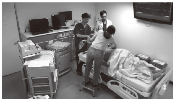
PGY急救模擬訓練課程-1

本院PGY急救模擬訓練，著重的學習目標有兩個部分：「急診知識和能力的學習」，與「團隊合作能力的鍛鍊」。筆者運用高擬真模擬人Istan設計模擬急救場景，讓學員身歷其境去直接經歷急救時的壓力，體驗時間壓力下每個急救決策的不確定性，進而學到實務的急救觀念和技巧。因此，從104年開始在本院的PGY醫師的訓練課程中，會安排每位來到急診的受訓醫師接受PGY急救模擬訓練。