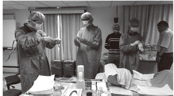
圖4、子宮頸抹片+咽喉採檢+穿脫隔離衣