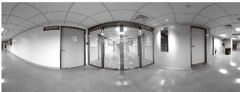
圖1、彰化基督教醫院臨床技能訓練中心

驗、教學熱誠及國考考官資格之醫師提供專業指導。在受訓的學員對於課程安排的認同方面，滿意度回饋問卷資料結果呈現4分以上，代表受訓學對課程達滿意程度（採5分法計算）（圖9）。課後安排學員提問及回饋，本中心也針對學員提出的問題給予積極的回覆，解答學員於培訓過中程所面臨到的問題及疑惑，達到雙向回饋。學員提問內容有：導尿管置放模組在操作上困難度較高、某些技能站的安排上學習的時間較為緊湊。除此之外，學員一致回映臨床技能訓練中心的設備、環境與師資都很棒，接受訓練後更有信心通過OSCE國家考試（圖10）！。開辦OSCE國考考前模擬訓練課程，反映彰基對於OSCE國家考試的重視，更藉由學員與中心互動的過程，鼓舞著中心工作人員的士氣！受訓的準醫師們，能在OSCE國考熾熱的光輝照射下，能夠破土而出，進而萌芽展露頭角，在各自開創的天空下擁有一番精彩萬分的表現，衝刺吧！準醫師！