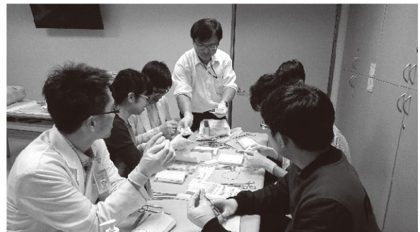
圖8、傷口縫合、傷口換藥、引流管拔除