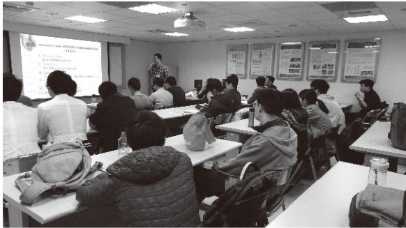
圖3、國考注意事項講解