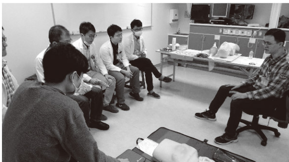
圖5、氣管內插管置入、基本心肺心肺復甦術