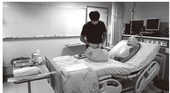
圖6、鼻胃管放置、導尿管放置、心電圖檢查