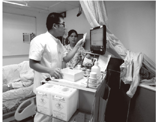
新進護理人員職前訓練課程 — 資訊口服給藥技術

因醫療作業電腦資訊化之關係，護理模擬情境設計會受限醫囑測試版作業系統功能是否開發之問題，但不管如何【情境模擬】已被證實是有效益的培訓方法，值得臨床技能訓練中心投入更多的心力與時間克服總總限制與困難。臨床技能訓練中心為醫護人員技能培訓後盾，未來中心會持續精進護理模擬情境課程設計，期待能協助更多新進護理新血留於護理職場服務，更期待能將每一位新進的護理人員培訓成為優秀、專業的護理師。