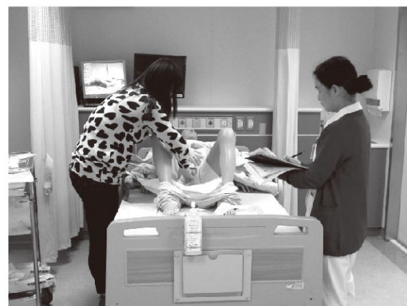
新進護理人員職前訓練課程—導尿技術