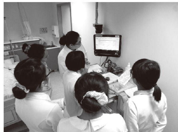
新進護理人員職前訓練課程—輸血技術