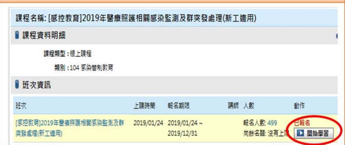
附表三：通過規則 與 列印